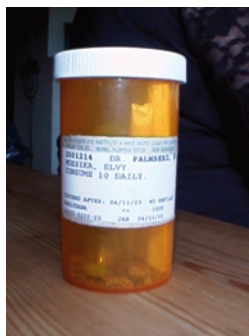
Jointer på boks.

I oktober '88, fikk jeg endelig statlig marihuana fra universitetet i Missis- sippi, levert gjennom «the National Institute of Drug Abuse» (NIDA). Alle pa- sienter som er med i det medisinske marihuana programmet har måttet bevise for både NIDA, «the Drug Enforcement Administration» (DEA) og «the Food and Drug Administration» (FDA) at marihuana var den tryg- geste, og mest effektive